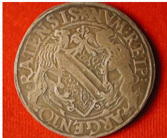
Monnaie Strasbourg XVIIe-XVIIIe s. Fleur de lys, écusson de la ville BNUS.